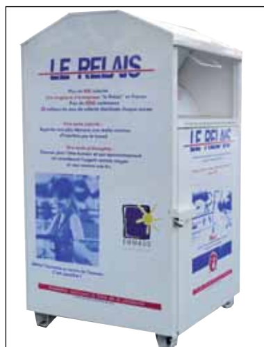
Borne Le Relais Val de Seine

Connectez vous directement sur notre site internet à la rubrique «Point d'Apport Volontaire» : une carte interactive vous permettra de visualiser l'emplacement des bornes vêtements de votre commune.