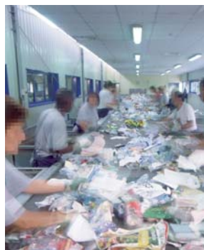
Centre de tri