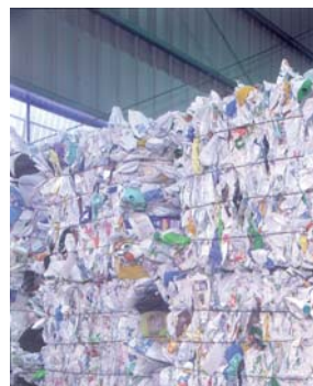
Mise en bales