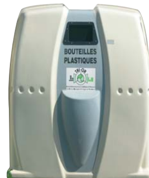
Point d'apport volontaire