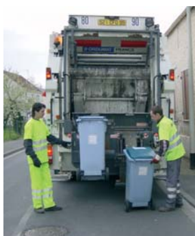
Collecte des bacs