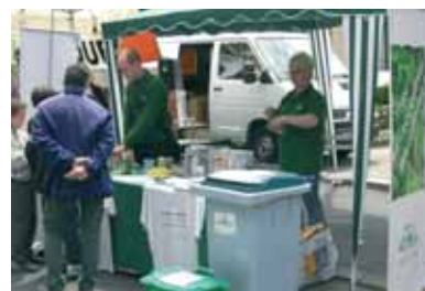
Brocante de l'Isle-Adam le 5 juin 2006.