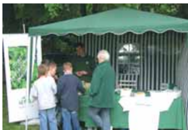
Brocante de Nointel le 21 mai 2006.

Pour de nombreuses manifestations, le syndicat a mis à disposition des organisateurs, des points "info-collecte" permettant à tous, grands et petits, de continuer le geste de tri à l'extérieur de son domicile.