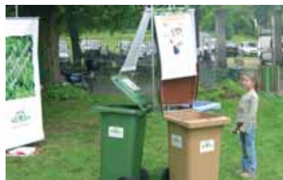
Les points "info-collecte" permettant de trier pendant les festivités.