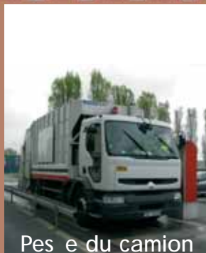
Pes e du camion