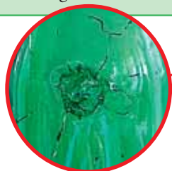
Exemple d'une inclusion

Pour l'année 2005, le syndicat Tri-Or a collecté, dans les 28 communes, 2894 tonnes de verre soit 37 kg de verre par habitant.