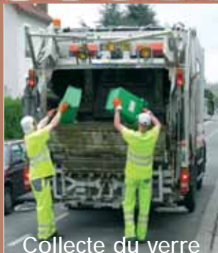
Collecte du verre