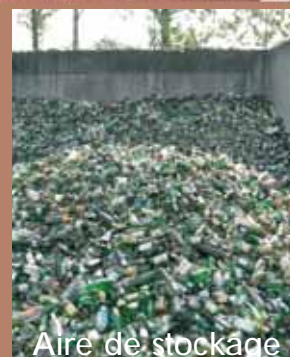
Aire de stockage

Les bacs verts sont de petite taille. Si besoin, vous pouvez obtenir un bac supplémentaire, en contactant le syndicat par téléphone au 01 34 70 05 60 ou sur le site internet www.tri-or.fr .