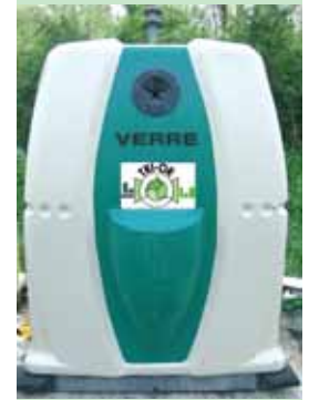
Point d'apport volontaire